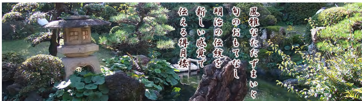
得月楼ホームページより