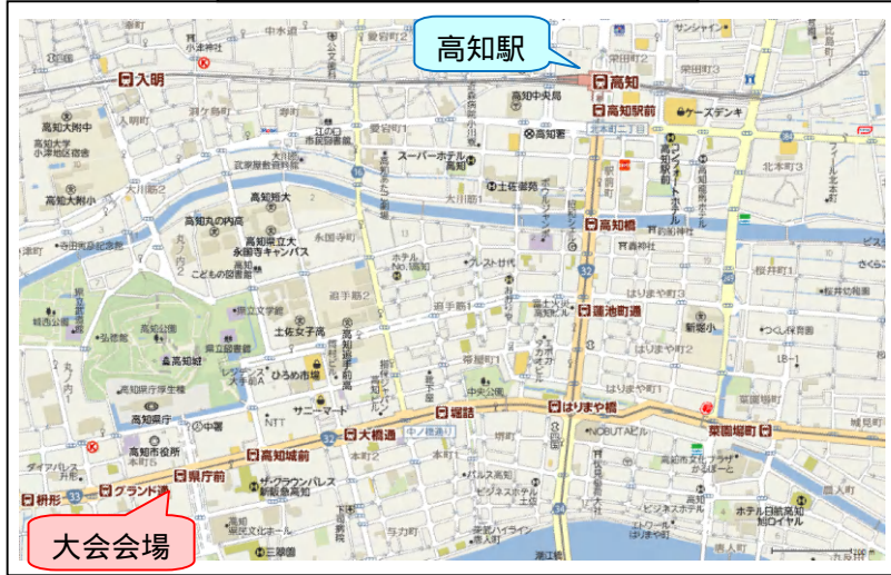
大会会場および高知駅周辺地図