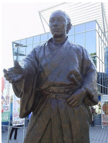
龍馬と握手(坂本龍馬記念館にて)