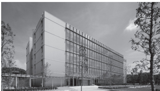
北九州技術センターE館