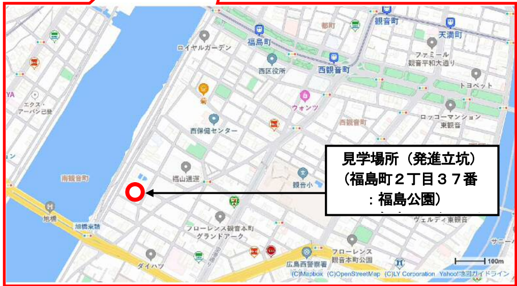
広島市三篠・観音地区大規模雨水処理施設整備事業概要図