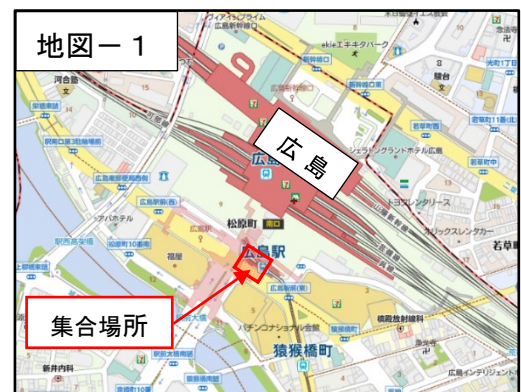
集合場所の詳細は次頁参照