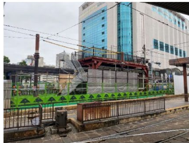
路面電車ホームから 現場事務所を見る