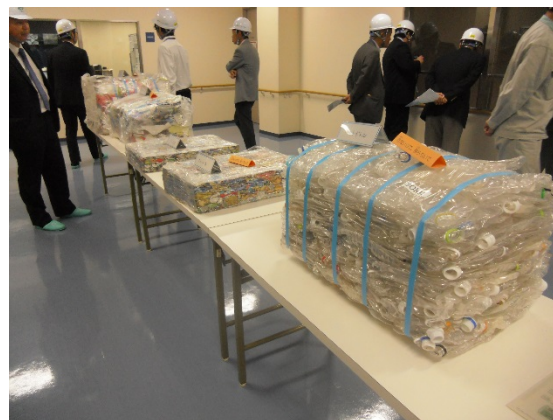
ペットボトル燃料