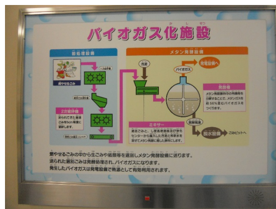
バイオガス化施設説明図

■ 可燃ごみ搬入、 ■ 見学者エリア、 ■ 執務エリア（立入禁止）、 ■ 作業エリア（立入禁止）